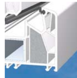
Ein optionaler Dämmkern sorgt für maximalen Wärmeschutz