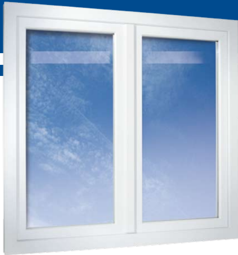
2-flügeliges Fenster flächenversetzt